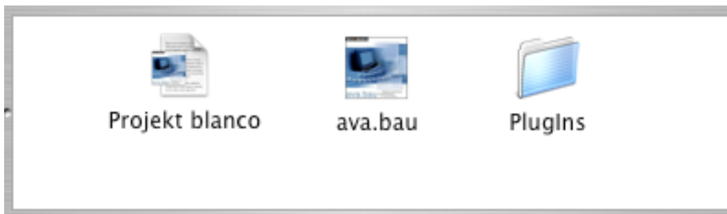
Ordnerinhalt Softwareinstallation Einzelplatz (lokaler Rechner)

Es kann nur ein Anwender gleichzeitig an einer Projektdatei arbeiten.